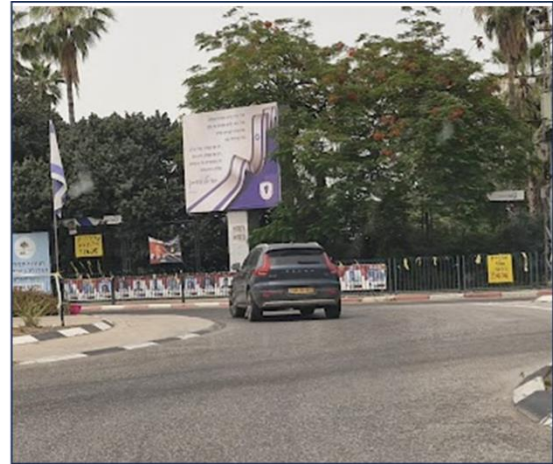
מבט נהג – מדרום מזרח