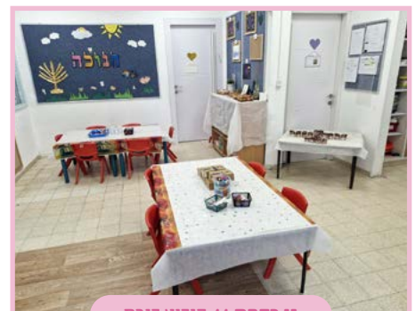
גן רקפת // קיבוץ נורת