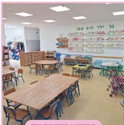
גן סביון // פוריה נווה עובד

גן סביון הוא משפחה חמה, עם צוות שפועל מאהבה, מלווה את הילדות והילדות ומשרה תחושה נעימה. הילדות והילדים זוכים כאן לחיבוק, אכפתיות, חיוך מאיר – בכל יום מחדש.