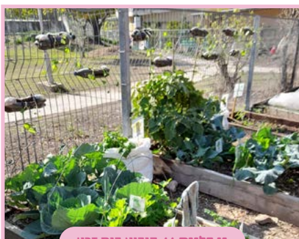
גן כלנית // קיבוץ בית זרע

ממוקם בקיבוץ בית זרע ונותן מענה לילדים בחינוך המיוחד עם עיכוב התפתחותי. אנו כצוות מאמינים שזכותו של כל ילד ללמוד בסביבה מעניינת, משתנה, מתחדשת בה הילד במרכז ומרגיש שייכות לגן ולקהילה.