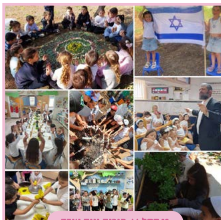
גן דקל // פוריה נווה עובד