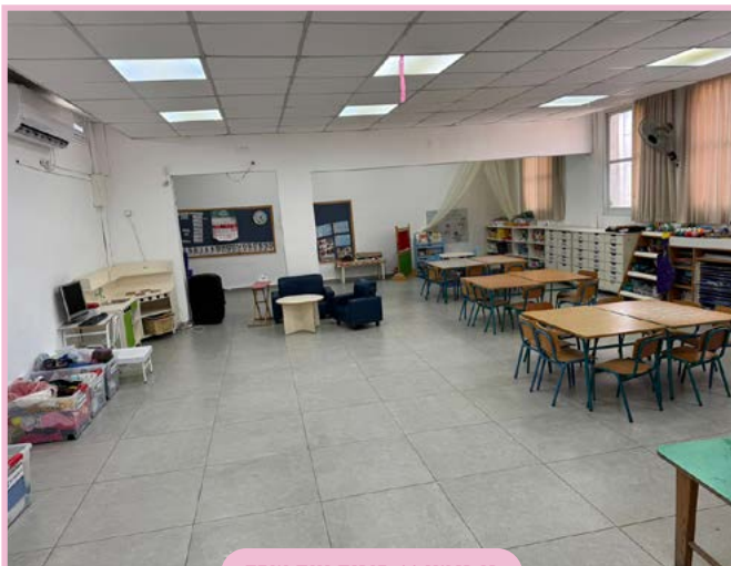
גן רימון // פוריה נווה עובד

גן המציע סביבה חמה, תומכת ומעשירה, בה מתקיימת למידה חווייתית, פעילה ומשמעותית. חזון הגן הינו לטפח ילדים סקרנים, בעלי ביטחון עצמי ואמונה, בסביבה המשלבת ערכים, אהבת התורה, האדם והטבע - תוך הקשבה והתייחסות לעולם הפנימי של כל ילד וילדה.