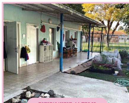
גן ורד // קיבוץ אפיקים