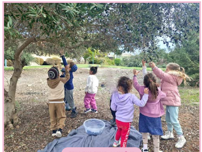
גן לינוי // פוריה נווה עובד